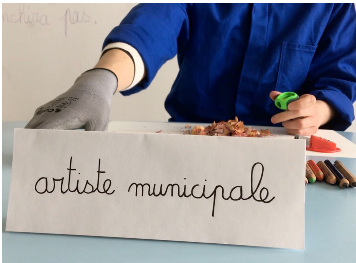
Atelier d'Anne Moirier.